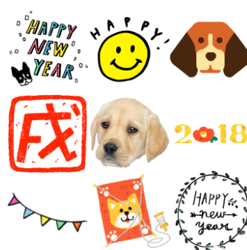
スタンプ及びスタンプ使用例