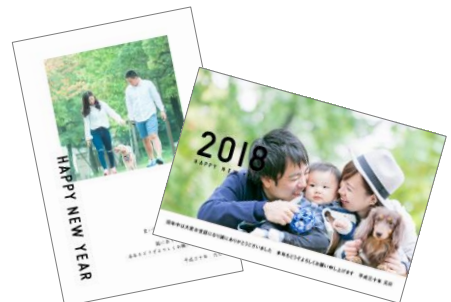
撮影した写真をつかって、その場でカンタ ンにかわいい年賀状が作れます

『わんことお年賀ラブグラフ』は、ワンちゃんと一緒に、お散歩したり遊んだりする姿を撮影し、その写真を使って年賀状をその場で作ることができるイベントです。