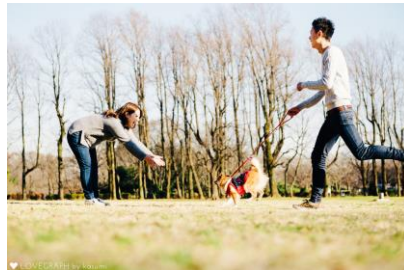
ヨークシャテリアやポメラニアンなど 1日2匹のモデル犬が登場！