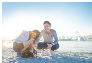
47 都道府県で撮影対応可能！

期間中、当メニューにお申込みいただいたお客様には、「ネット/スマホで年賀状」のお得なクーポンを進呈！