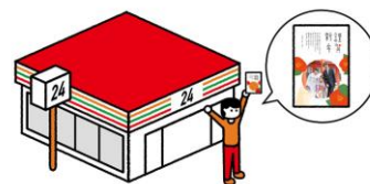
5. セブン-イレブンで印刷