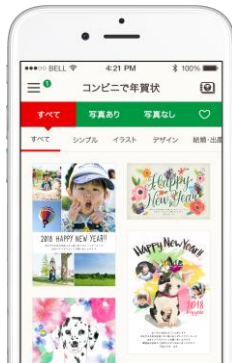
<サービスロゴとアプリ画面イメージ>