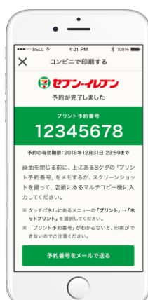
4. プリント予約番号を発番