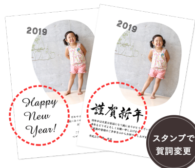
賀詞部分を送り先に合わせて変更可能！