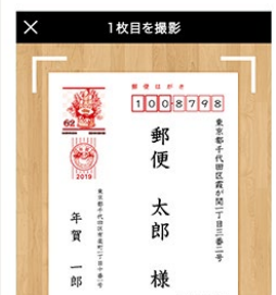
宛名スキャンサービス画面

※利用が集中した場合など、宛名スキャンサービスのご提供を中断する場合がございます。