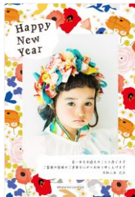
スカンジナビアン・パターン・コレクション

https://net-nengajo.jp/special/hamamonyo/