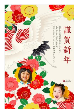
「kichijitsu 年賀状」デザインの一部