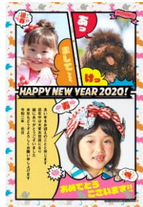
ファンタジスタ歌磨呂

https://net-nengajo.jp/special/mai-ohata/