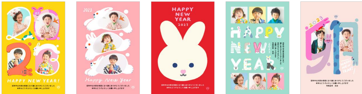
「AIUEO」年賀状【販売サイト】 https://net-nengajo.jp/sp/special/aiueo/

カラフルで楽しい柄が見る人を楽しめる気持ちにさせる「AIUEO」。今年も「スマホで年賀状®」のために描き下ろした干支やお正月をモチーフにしたデザインを盛りだくさんでラインナップ。写真なしタイプも各絵柄に用意されています。