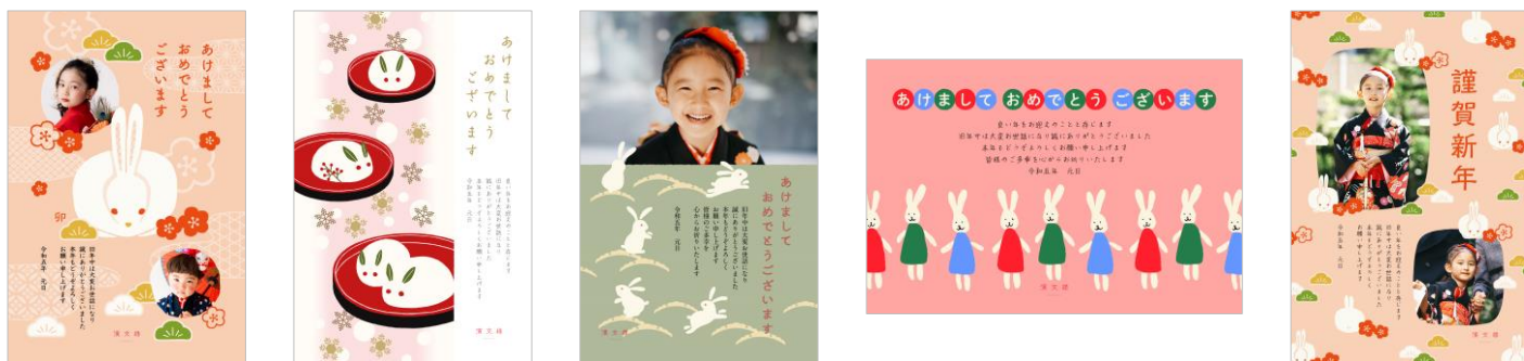
「濱文様」年賀状【販売サイト】 https://net-nengajo.jp/sp/special/hamamonyo/

横浜伝統の捺染(なっせん)で染め上げた色鮮やかな配色と多彩な柄が特徴の「てぬぐい」ブランド「濱文様」。今年も新作の干支デザインをラインナップ。年賀状は和の雰囲気で作りたいという方にぴったりのデザインが勢ぞろい。