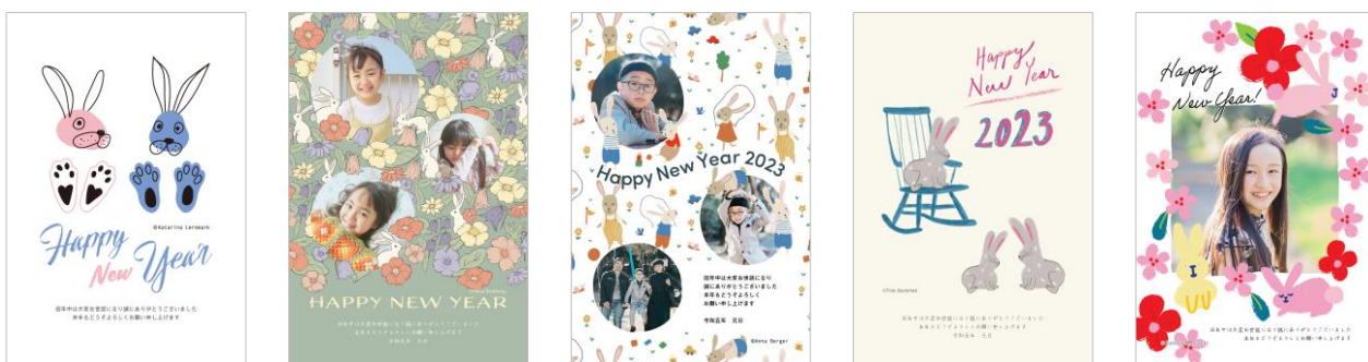
「andfika selection (北欧デザイン特集)」年賀状【販売サイト】 https://net-nengajo.jp/sp/special/scandinavian/

北欧と日本をデザインでつなぐandfika (アンドフィーカ) より、今年はScandinavian Pattern Collection、HEJ&MOI、brokigaの3ブランドに加え、北欧で活躍するデザイナーによる描き下ろしを含めた干支デザインが登場です。